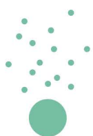
非カプセル化冷感剤